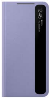
Clear View Cover EF-ZG991