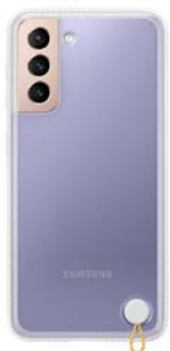
Clear Protective Cover EF-GG991