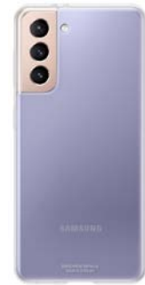
Clear Cover EF-QG991