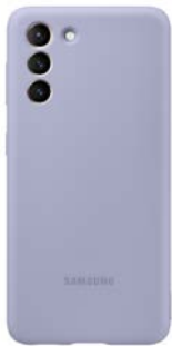
Silicone Cover EF-PG991