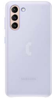
LED Cover EF-KG991