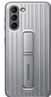
Protective Standing Cover EF-RG991