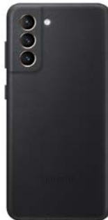
Leather Cover EF-VG991