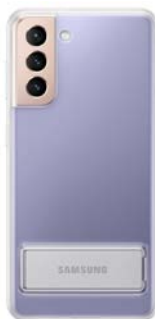
Clear Standing Cover EF-JG991