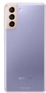
Clear Cover EF-QG996