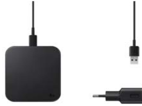
Wireless Charger Pad EP-P1300T