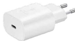
Schnelllade- adapter 25 Watt EP-TA800N