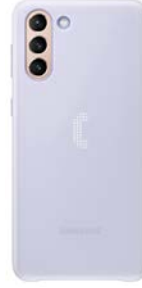
LED Cover EF-KG996