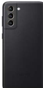
Leather Cover EF-VG996