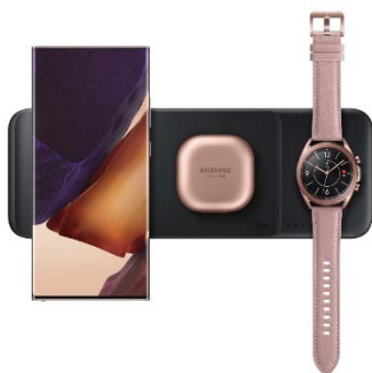
Wireless Charger Trio EP-P6300