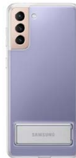
Clear Standing Cover EF-JG996