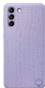
kvadrat Cover EF-XG996