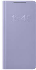
LED View Cover EF-NG996