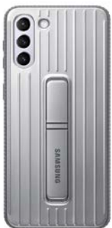
Protective Standing Cover EF-RG996