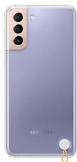
Clear Protective Cover EF-GG996