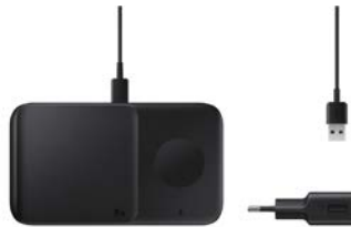
Wireless Charger Duo EP-P4300T