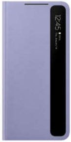
Clear View Cover EF-ZG996