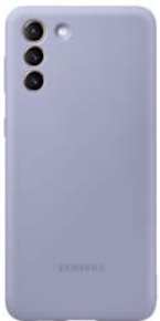
Silicone Cover EF-PG996